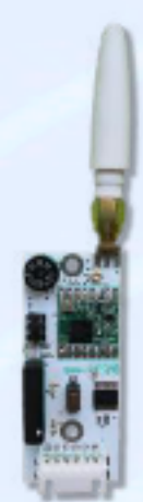
RF RECEIVER РАДИОПРИЕМНАЯ ПЛАТА