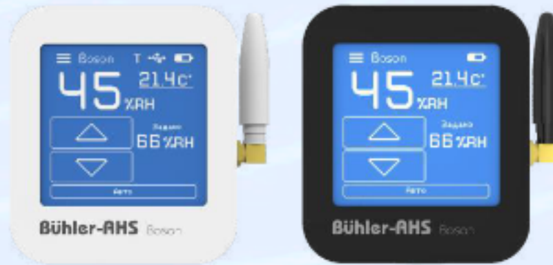
BOSON / BOSON BL БЕСПРОВОДНОЙ ПУЛЬТ УПРАВЛЕНИЯ