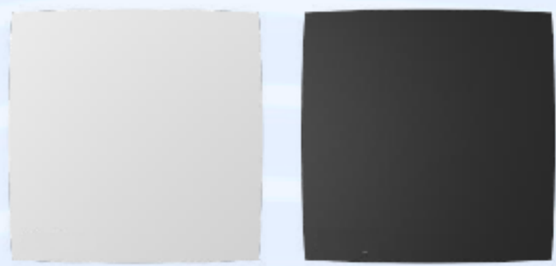
MHS1 / MHS1 BL МАКСИМАЛЬНЫЙ ГИГРОСТАТ