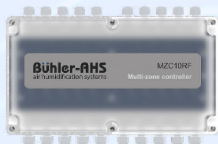
MZC 10RF ЗОНАЛЬНЫЙ КОНТРОЛЛЕР