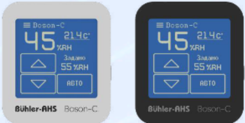
BOSON-C / BOSON-C BL ПРОВОДНОЙ ПУЛЬТ УПРАВЛЕНИЯ