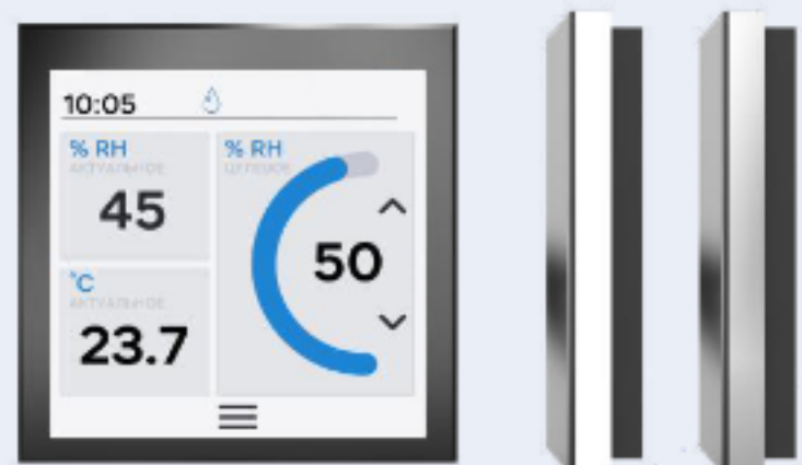
HS4 (WHITE / NICKEL)